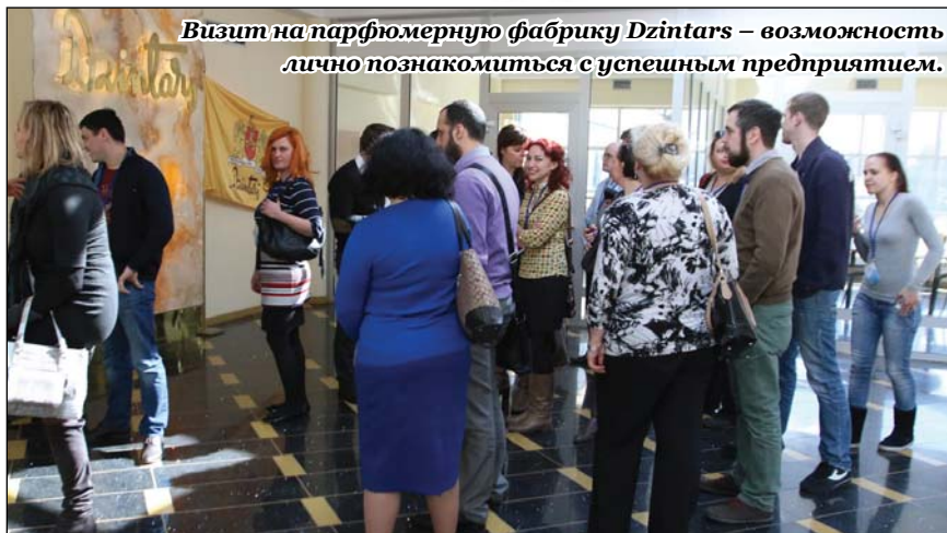
Визит на парфюмерную фабрику Dzintars – возможность лично познакомиться с успешным предприятием.

В рамках программы BJT Weekend были представлены следующие компании: Inspired Digital – первое (создано в 2009 году) и самое большое в странах Балтии (более 30 работников) социальное медиа-агентство, Dzintars – Латвийская компания, выпускающая парфюмерию и косметику, а также акционерное